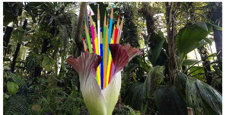
Evènement inattendu au Jardin des Plantes de Nantes : Une seconde floraison du Pénis de Titan en hommage à CHARLIE HEBDO

Nous souhaitons le succès pour nos jeunes en cette première année sous le statut public et formulons aux personnels le vœux d'une adaptation réussie dans une organisation nouvelle.