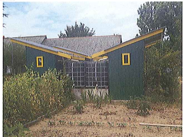
La Chapelle sur Erdre

Ces 2 modèles de jardins, diamétralement opposés sur le concept, révèlent néanmoins une tendance forte des communes dans cette démarche qui vise à permettre aux habitants de cultiver un petit lopin de terre.