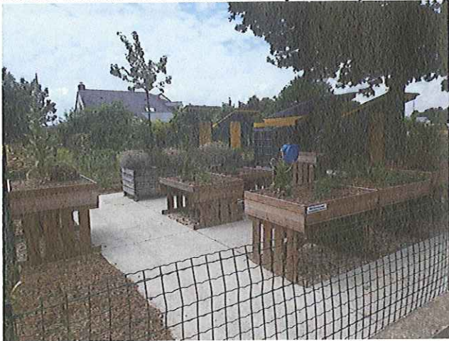
Tablettes PMR La Chapelle sur Erdre

Des jardins sur tablettes permettent aux personnes à mobilité réduite de s'adonner aux joies du jardinage.