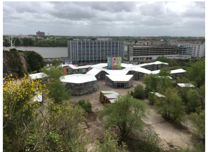
Le site actuellement

La Ville de Nantes a lancé sur le futur site d'installation de l'Arbre aux hérons, une opération intitulée "Complètement Nantes" qui va pendant 80 jours, jusqu'au 30 juin, faire vivre le site de la carrière Miséry et permettre, dans le cadre d'une exposition permanente, de présenter au grand public le Nantes de demain avec tous les projets (12 priorités) qui transformeront la ville dans les années à venir.