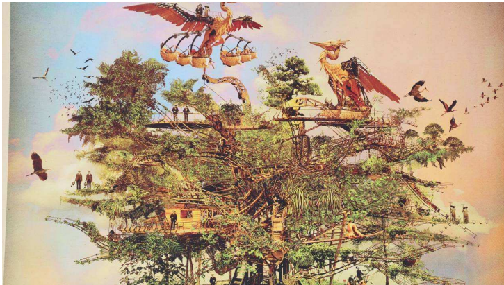
Dessin du futur Arbre aux hérons. | Stephan Muntaner

Le public peut déjà tester une partie du futur bestiaire mécanique de l'arbre dans la "Galerie des Machines". Un colibri géant et deux oies viennent d'y faire leur entrée, au côté d'une chenille, de fourmis et d'une araignée.