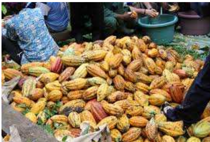
Les cabosses récoltées

Le projet Keka Wongan est un projet de commerce équitable de cacao entre le Cameroun et la France. Le but est de fabriquer du «chocolat pédagogique» c'est à dire, apprendre à consommer du chocolat en sachant d'où il vient, qui l'a produit, quelles sont les conditions de vie des producteurs, quels changements dus à la transformation en produit fini impactent le quotidien de ceux qui vivent grâce à cette culture. Mieux vivre de son travail en apportant soi même et in situ la valeur ajoutée est le principe du projet.